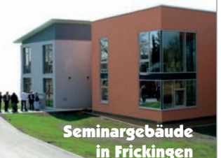
Seminargebäude in Frickingen

Tel.: 07552 / 262 - 0 Fax: 07552 / 262 - 109